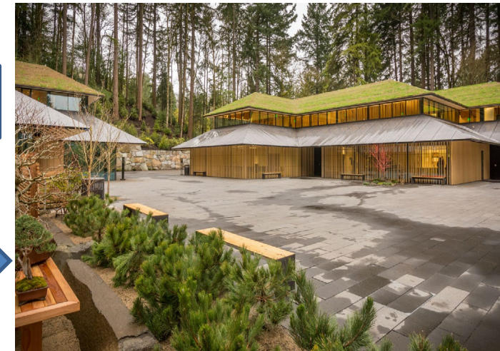
《ポートランド日本庭園》